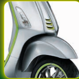
ΠΡΑΣΙΝΟ VERDE BOREALE