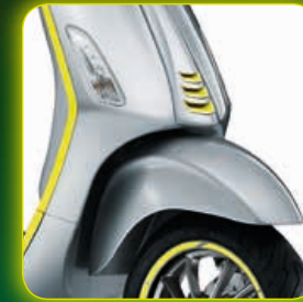
ΚΙΤΡΙΝΟ GIALLO LAMPO