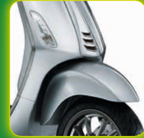
ΓΚΡΙ GRIGIO FUMO μόνο στην έκδοση 45km/h