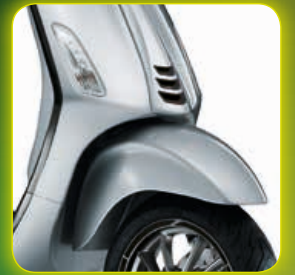
ΜΑΥΡΟ NERO PROFONDO