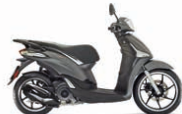
ΓΚΡΙ MAT "GRIGIO TITANIO"