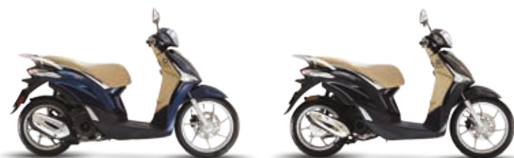
ΜΠΛΕ "BLU COBALTO"