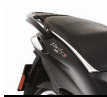
ΜΑΥΡΗ ΧΕΙΡΟΛΑΒΗ ΣΥΝΕΠΙΒΑΤΗ