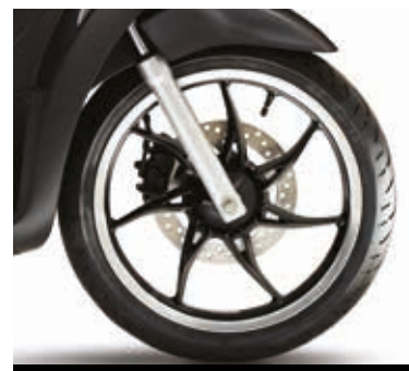
ΜΑΥΡΕΣ ΖΑΝΤΕΣ ΜΕ ΑΣΗΜΙ ΦΙΝΙΡΙΣΜΑ

Η έκδοση "S" εκφράζει έναν πιο ενεργητικό και δυναμικό χαρακτήρα. Διακρίνεται για τα ιδιαίτερα φινιρίσματα της σέλας, το ασημί περίγραμμα των ζαντών και τους μαύρους καθρέπτες. Διατίθεται σε 3 εκδόσεις κυβισμού: 125 και 150 cc με ABS στον εμπρός τροχό, και 50, στους χρωματισμούς Γκρι ματ «Grigio Titanio» και Μαύρο ματ «Nero Meteora».