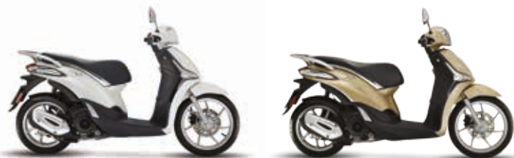
ΛΕΥΚΟ "BIANCO LUNA"

50 i-get | 125 i-get ABS | 150 i-get ABS