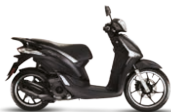
ΜΑΥΡΟ MAT "NERO METEORA"

50 i-get | 125 i-get ABS | 150 i-get ABS